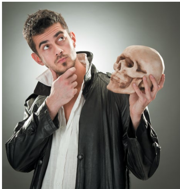
«Так погибают замыслы с размахом...» У. Шекспир

главный администратор доходов бюджета – это определённый законом о бюджете орган государственной власти, имеющий в своем ведении администраторов доходов бюджета;